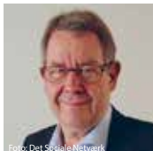
Poul Nyrup Rasmussen