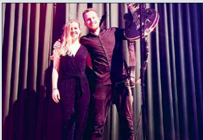
ME AND MARIA på scenen i Brønderslev med SIND